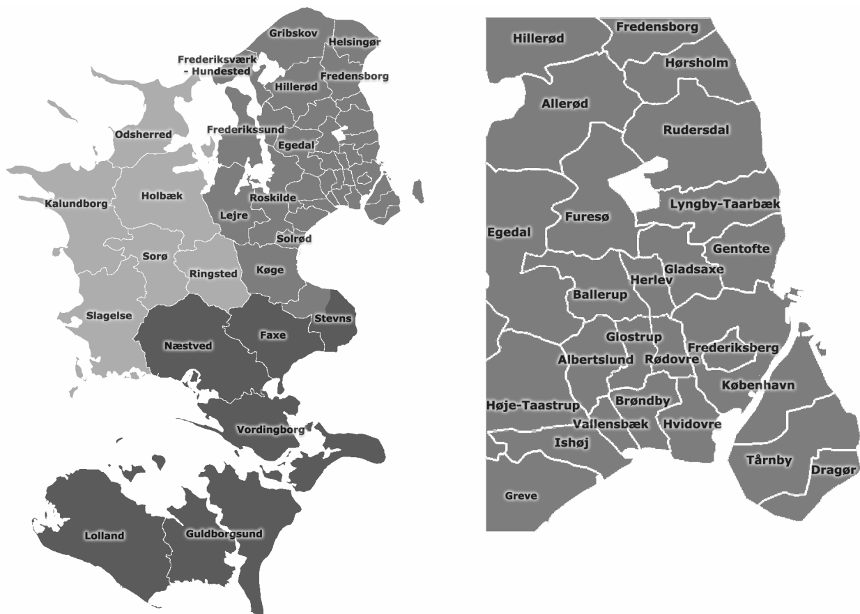
Figur 1 – Takstområder og kommuner

Buskørsel er Movias alt dominerende produkt. Busdriften står for 59% af Movias samlede tilskudsbehov.