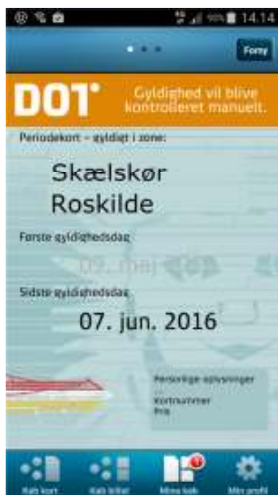
Pendlerkort eksempel - udstedt til en strækning (Skælskør til Roskilde) – OBS muck-up – korrekt eksempel kommer senere. – skal hedde pendlerkort og der skal angives zonenumre

Lange rejser – udstedes til relationer for rejser fra 9 zoner