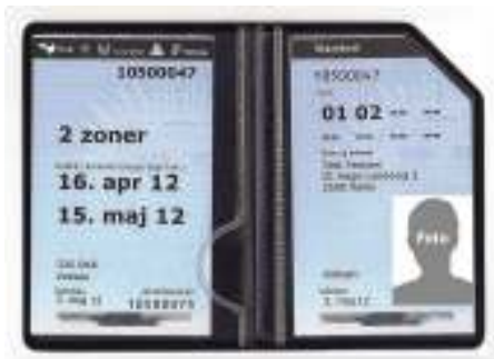
Pendlerkort, eksempel - udstedt til 2 navngivne zoner (zone 1 og 2)

Korte rejser - udstedes med påtrykte zoner til og med 8 zoner