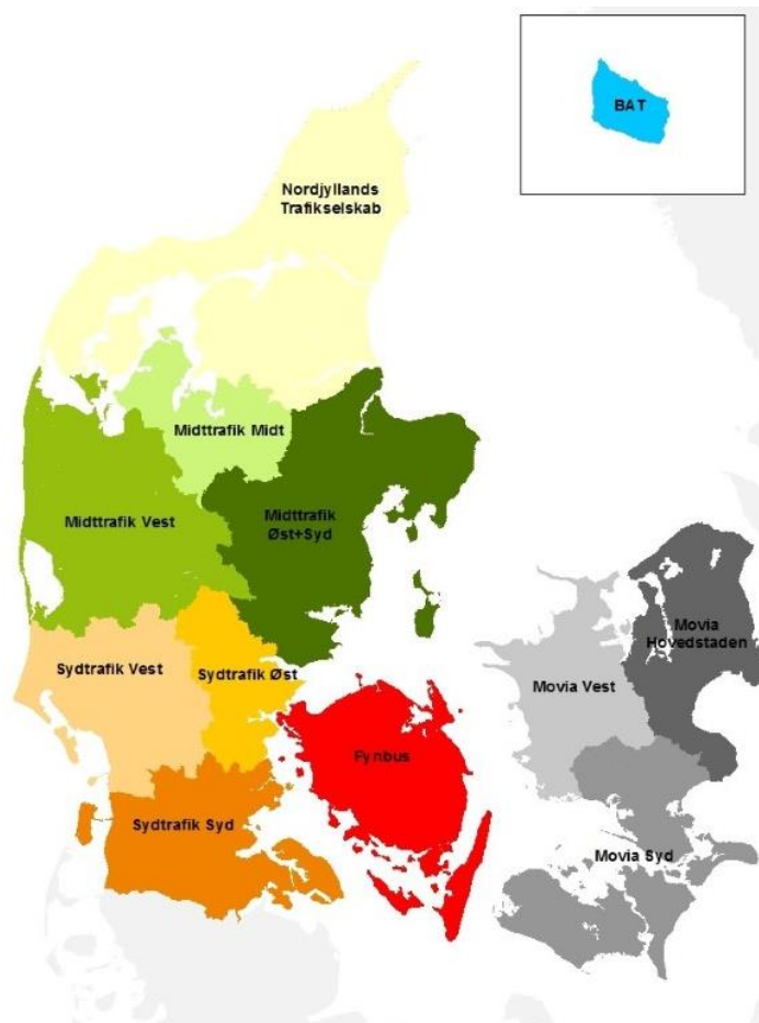
Figur 3 fra bekendtgørelse om ungdomskort

En ung, der bor i nabobyen St. Heddinge i Movia Hovedstaden, kan derimod rejse uden yderligere betaling i hele hovedstadsområdet.